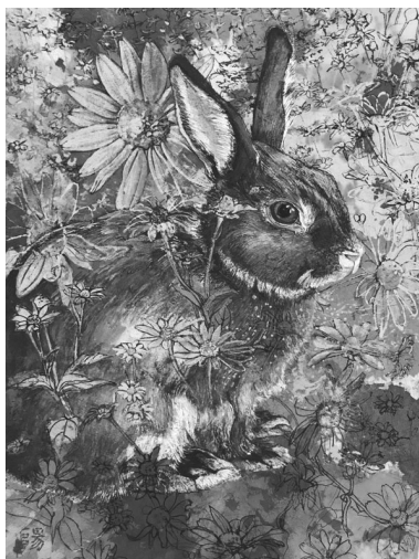
《ながれるままにーあちらへ》