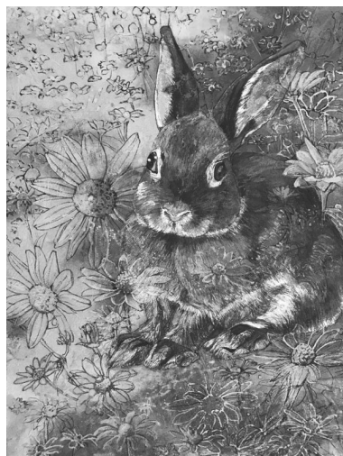
《ながれるままにーこちらへ》

この度、ご縁をいただき最上川美術館にて初めての企画展、初個展をすることとなりました。父の故郷である山形県に住み絵の制作。昨年亡くなった父を偲びさらに純粋な気持ちで画面に向かうようになりました。