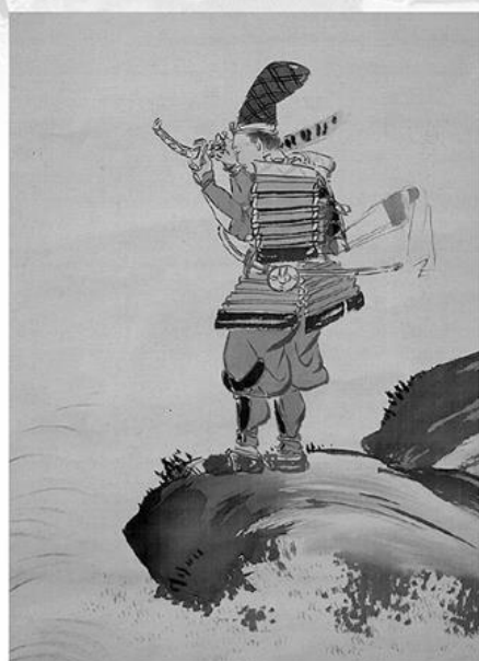
武者絵「新田義貞・稲村ヶ崎之絵図」 【大正時代】