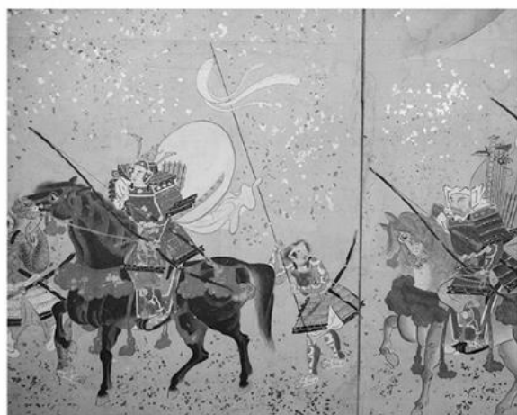
「源平合戦図屏風・部分図」源義経と弁慶 【明治時代】