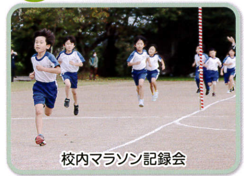
校内マラソン記録会