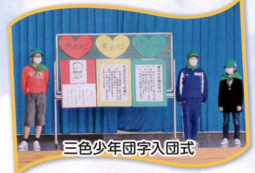
三色少年団字入団式