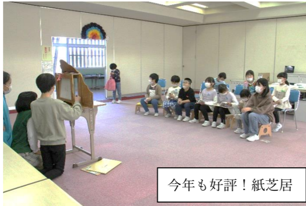
今年も好評！紙芝居

保護者の皆様、お忙しい中親子読書にご協力いただき、心温まるコメントありがとうございました。お子さんと一緒に読書を楽しんでおられる様子や、読書を通じて親として伝えたいことなど、保護者の皆様の思いがひしひしと感じられました。いくつか紹介します。