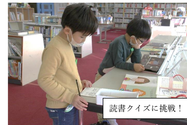
読書クイズに挑戦!

「『天空の城ラピュタ』の飛行石という名前を当てるクイズに挑戦しました。クイズに正解して賞品をもらえてうれしかったです。」と1年生が教えてくれました。