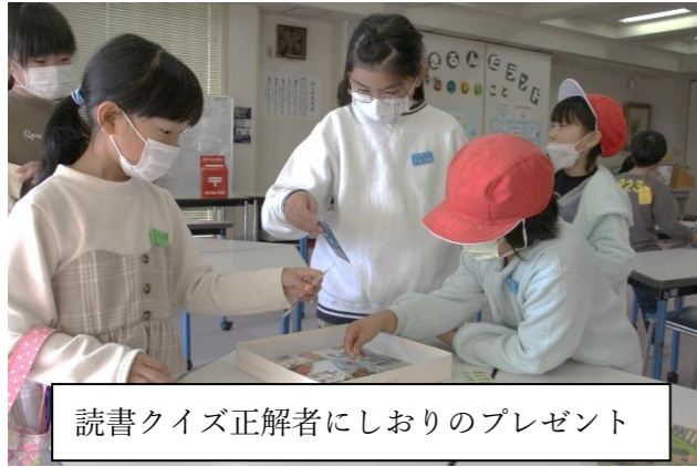
読書クイズ正解者にしおりのプレゼント