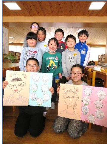
【お口チャックでハイチーズ】