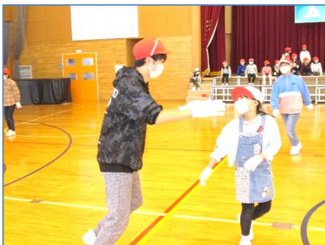
【6年生が1年生と鬼ごっこで交流】

つながりは時間の長さではなく触れ合う質の濃さに比例するようです。運動会や児童委員会、兄弟学級の交流活動、昇降口で登校時の雪はらいなど、6年生は下級生にとって本当に頼りになるあこがれの存在です。6年生の皆さん、ありがとうございました。