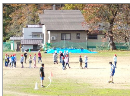
【グラウンドでサッカーや鬼ごっこ】