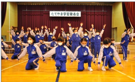
【3年生:指先までぴんと決めポーズ】

合いながら、さらによりよいものに改善していく力』は、とても大切です。学年が上がるにつれ、この力が付いていることが発表や練習の様子から分かります。特に高学年は、脚本作り、道具作り、演出を自分たちでやり抜きました。素晴らしいことです。