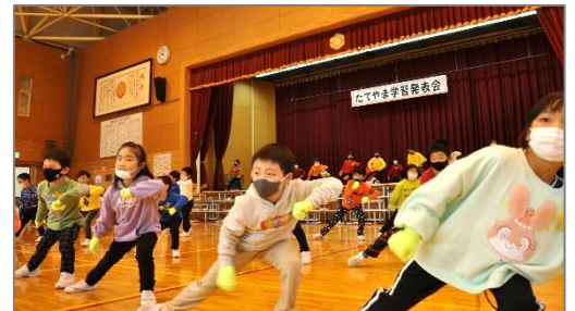
【2年生:体全体、はじからはじまで】

例年の半分以下の練習にもかかわらず、すべての学年が見ごたえのある「かっこいい」学習発表でした。休み時間も惜しんで自分たちだけで練習したり、道具を作ったりする姿があちらこちらで見受けられ、大変頼もしく感じました。『自分たちで考え話し