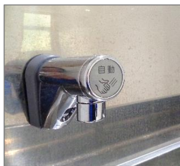
【トイレの自動蛇口】