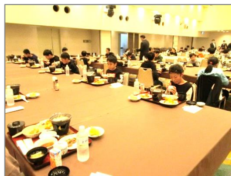
【ディスタンスが確保されたホテルの夕食】

一人一人が行く先々で楯岡小学校の名を高めてくれました。6年生の皆さん、ありがとうございました。