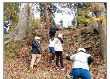
【たてやまでロープ登り】