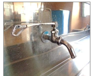
【手洗い場のレバー式蛇口】