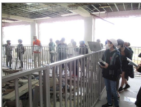
【校舎 3 階まで破壊した津波】