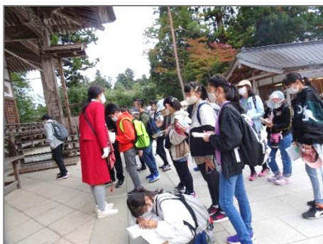
【中尊寺で熱心にメモを取る 6 年生】

10月22日(木)~23日(金)に宮城県気仙沼、岩手県平泉・花巻方面に修学旅行に行ってきました。新型コロナの影響で7月から実施時期を延期し、密を避けるためバスも1台増やしました。