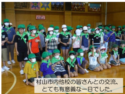
村山市内他校の皆さんとの交流、とても有意義な一日でした。

8月1日(火)「村山市緑の少年団交流会」が山の内自然体験交流施設「やまばと」で開催されました。村山市内の全ての小学校に『緑の少年団』が結成されており、本校は平成16(2004)年から加盟し、来年20周年を迎えます。この日は村山市内小学校7校から59名が参加し、本校からは4年生16名が参加しました。