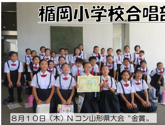
8月10日（木）Nコン山形県大会「金賞」

8月10日（木）に「第90回NHK全国学校音楽コンクール山形県大会」が天童市で開催され、見事「金賞」を受賞しました。これは14回連続（コロナ禍により令和2年度は中止）の快挙です。NHKコンクールは9月17日（日）に宮城県名取市で開催される「東北ブロックコンクール」に出場します。