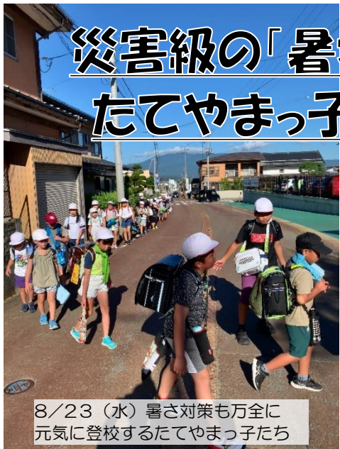
8/23(水)暑さ対策も万全に 元気に登校するたてやまっ子たち

夏の暑さを避けるための長期休業のはずが、肌に突き刺す陽射しに、肌の「熱さ」や「痛み」を超えて、本当に「火傷するのでは…!?!」とさえ感じるような災害級の猛暑が続いています。天気予報では、今後も十分な警戒が必要とのこと。今年度は、本日より標題下に、日本の季節感をとても良く表す太陽の動きをもとにした「二十四節気」を記載してきました。季節の変わり目をぴたりと表しているなあと常々思っているのですが、今年ばかりはどうも違うようです。