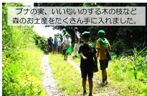
フナの実、いい匂いのする木の枝など森のお土産をたくさん手に入れました。

8月1日(火)「村山市緑の少年団交流会」が山の内自然体験交流施設「やまばと」で開催されました。村山市内の全ての小学校に『緑の少年団』が結成されており、本校は平成16(2004)年から加盟し、来年20周年を迎えます。この日は村山市内小学校7校から59名が参加し、本校からは4年生16名が参加しました。