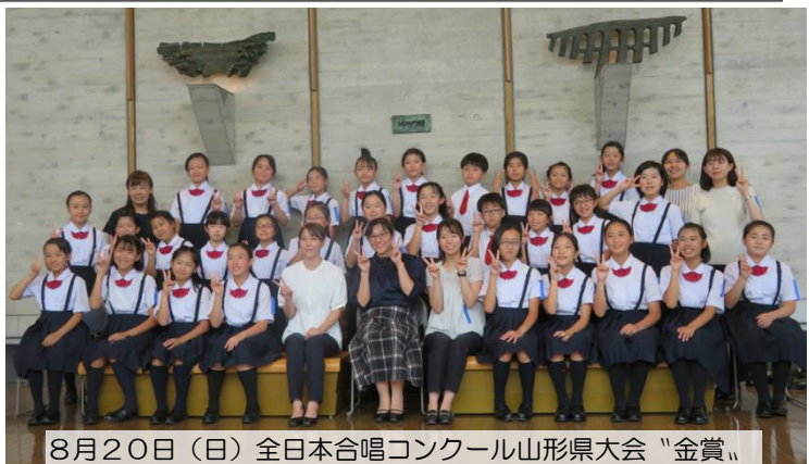
8月20日（日）全日本合唱コンクール山形県大会「金賞」

この夏休み期間中も学校や市民会館で練習に励んだ合唱部の皆さんです。猛暑続きの中もいつも笑顔で元気に練習に励んだ成果です。