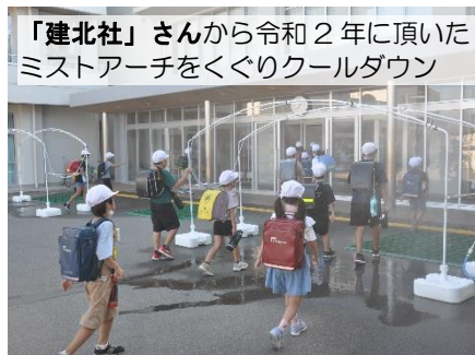
「建北社」さんから令和2年に頂いた ミストアーチをくぐりクールダウン

学校の印象としては、例年の夏休み明けの数日間は、何となくどんよりとした雰囲気が続き、2週目に入りようやく調子を取り戻す感じですが、今年はまったく違います。きっとご家族や親戚、地域等で楽しく充実した日々が過ごせたのでしょ。他人に指示され、与えられる家庭生活や学習の課題ではなく、自ら決めて取り組む夏休みの在り方にうまくシフトチェンジできたのではないのでしょうか。大きな病気や怪我、事故等の報告もほとんどありませんでした。ご家庭や地域等でのご理解とご指導、見守りに感謝申し上げますとともに、たてやまっ子一人一人に自主・自立の姿勢が少しずつ、そして確実に育っていることに、保護者の皆様とともに喜びたいと思います。