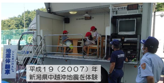
平成19(2007)年新潟県中越沖地震を体験

本校では、ボランティア委員会がその活動の中心となり、アルミ缶回収や赤い羽根共同募金活動を積極的に行っています。人として生きる道を学ぶ活動として、これからも大事にしていきます。