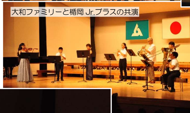
大和ファミリーと楯岡 Jr.プラスの共演