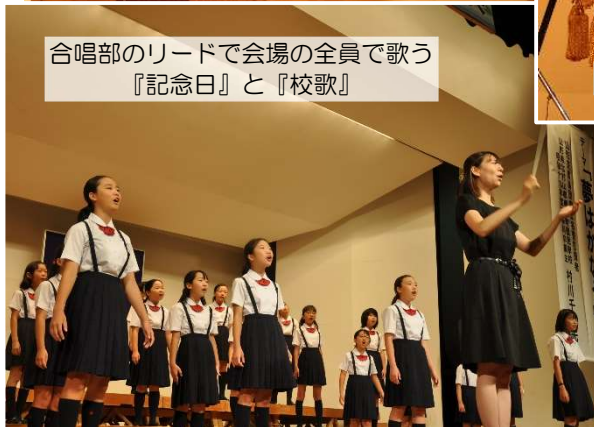
合唱部のリードで会場の全員で歌う『記念日』と『校歌』