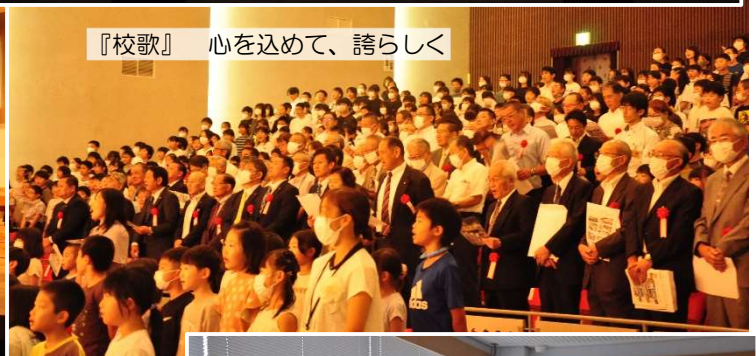
『校歌』心を込めて、誇らしく