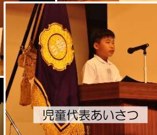
児童代表あいさつ