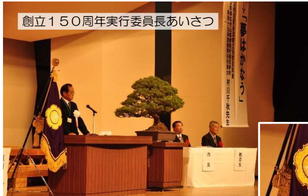
創立150周年実行委員長あいさつ

9月3日(日)村山市民会館を会場に、本校児童を始め日頃よりお世話になっているご来賓・地域・保護者の皆様、約800名が集い、創立150周年記念式典を盛大に開催することができました。楯岡小学校後援会、PTA、子ども会育成会を始めとした創立150周年記念事業実行委員会の皆様を始め日頃より本校の教育活動を全面的に支えてくださっている皆様のおかげで、創立150年の歴史と伝統に相応しい式典になりましたこと、この場をお借りして心より御礼申し上げます。