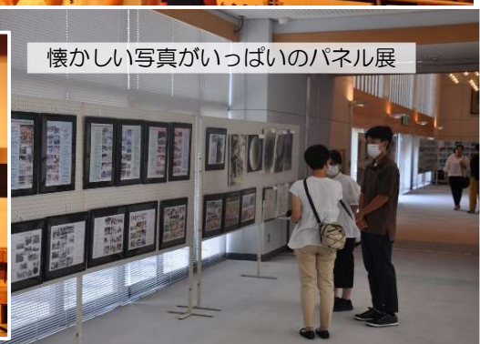
懐かしい写真がいっぱいのパネル展