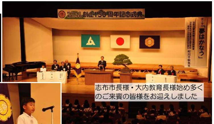
志布市長様・大内教育長様始め多くのご来賓の皆様をお迎えました