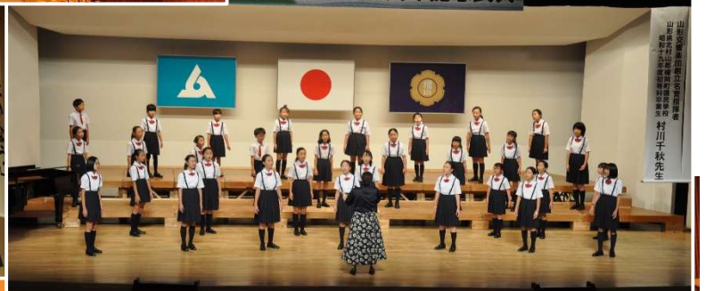
合唱部の皆さんの美しいハーモニーが会場全体を包む