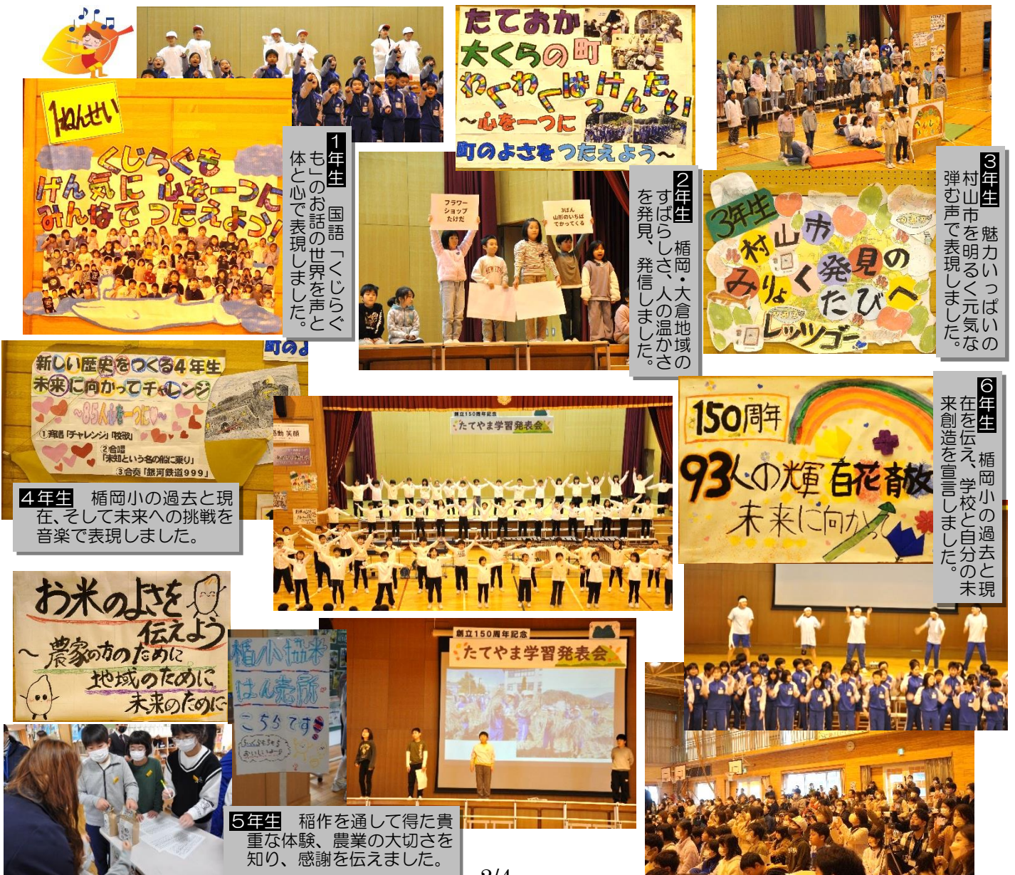
1年生 国語「くじらぐも」のお話の世界を声と体と心で表現しました。

児童会集会委員会が中心となって定めたスローガン『1チーム ONE TEAM ~ひとりみんなのために みんなはひとりのために~伝えよう学び創り上げてきた姿を』の下、各学年では日頃の学習成果について児童主体の実行委員を中心に工夫を凝らして発表しました。