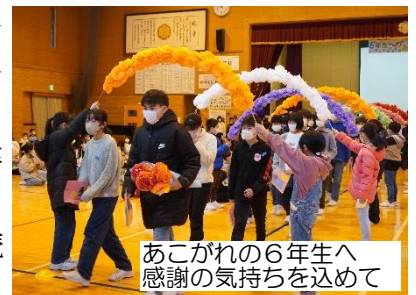
あこがれの6年生へ 感謝の気持ちを込めて

に、毎日に教えられ続けた令和5年度でした。また新たな1年、新たな出会いと発見を求めて、たてやまっ子たちと共に歩み続けてまいります。今後ともご理解とご協力をお願いいたします。