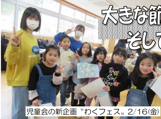
児童会の新企画「わくフェス」2/16(金)

3/20~二十四節気「春分(しゅんぶん)」 昼夜の長さがほぼ同じになり、昼がだんだん長くなっていく。