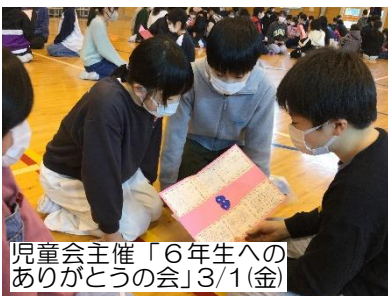
児童会主催「6年生への ありがとうの会」3/1(金)

しかし実際は、大人たちが経験してきた「これまでは…」は、どうも通用しないことばかりでした。そしてその度に、社会や教育の「不易と流行」をしっかりと見極め、それぞれの思いや願いに耳を傾けながら、どこに着地点を定め、どうやって物事を進めていくのか、みんなで悩み続けたコロナ禍明けの1年となりました。しかも今年度は、創立150周年というそれこそ大きな節目の年。地域や保護者そして関係する全ての皆様のご理解とご協力のおかげで、何とか今日を無事に迎えていると感じます。この場を借りて改めて皆様に感謝したいと思います。