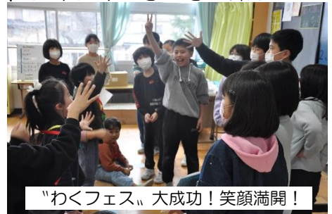
「わくフェス」大成功！笑顔満開！

そして令和5年の5月。悩まされ続けた新型コロナウイルス感染症が5類感染症へ移行して、いよいよコロナ禍が明け、あの令和元年スタート時のわくわく、どきどきが再び...といった感じでスタートしました。