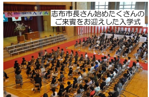
志布市長さん始めたくさんのご来賓をお迎えした入学式

始業式では、一つ上の学年となった2~6年生に、昨年度取り組んできた「自分で・自分たちで 考える・決める・行動する」をベースにして、今年度は「3 COMS(読み:スリーコムズ、いずれも英語のCOM~で始まる単語)」でがんばろうと話しました。学校教育目標『志』達成のための仲間をつくる「コミュニティ形成力」、『感動』を自分の言葉で伝える「コメント力」、『笑顔』で人とつながる「コミュニケーション力」の3つです。