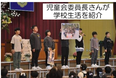
児童会委員長さんが学校生活を紹介

入学式では、84名の1年生に学校教育目標の「笑顔(えがお)」の「あいさつ」をがんばっていくことを約束しました。楯岡小の子供たち「たてやまっ子」は、実に素直です。この2週間、一つ上の学年となった喜びをどの学年の子供たちもしっかりともちながら、笑顔のあいさつとやる気に満ちた毎日を過ごしています。