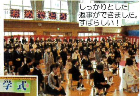
しっかりとした返事ができました。すばらしい!