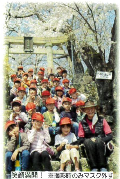
笑顔満開! ※撮影時のみマスク外す

連日、天候に恵まれ、春らしい青空と満開の桜の下、県指定天然記念物「愛宕神社のケヤキ林」が岩を割って伸びる姿に圧倒されました。教室に戻り、絵を描いて校外学習を振り返りました。1年生の皆さんの話の聞き方や受け答えなどの反応がとても良く、お褒めの言葉をいただきました。