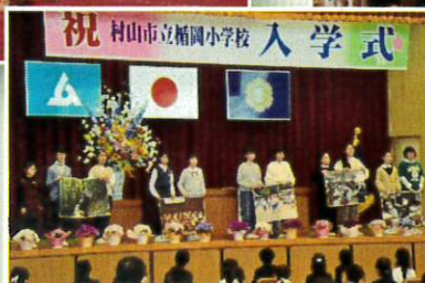
児童会を代表して、6年生の新委員長11名が、学校紹介をしました。