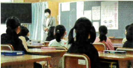
始業式は、リモート開催 学年・学級開きは丁寧に