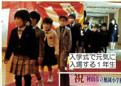
入学式で元気に入場する1年生