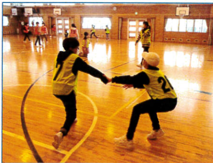
【5年生と王様鬼ごっこ】

5年生では6年生が企画したお楽しみ会で「王様鬼ごっこ」を一緒に楽しみました。5年生はその企画力と準備力に驚いたようです。最高学年としての思いも引き継ぐことができました。