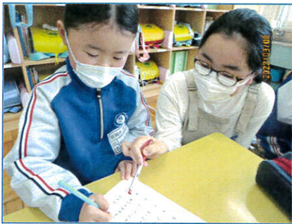
【1年生に算数のレッスン】

卒業式を間近に控えた3月上旬、6年生は各学年の兄弟学級に出向いて様々な交流活動を行いました。