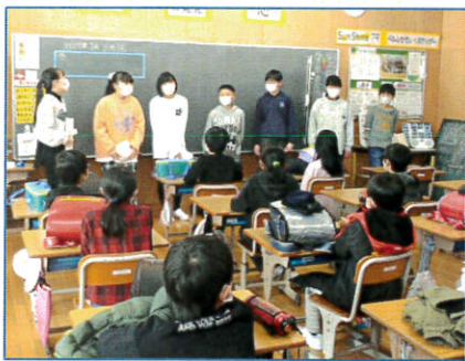
【3年生にクラブ活動を紹介】

1年生では算数の復習をするため手作りプリントを用意し、先生となって優しく教えてあげました。中にはチャレンジ問題もあり、計算の仕方確かめながら仲良く楽しく一緒に勉強しました。1年生の目には、とっても頼れるお兄さん・お姉さんに映ったことでしょう。