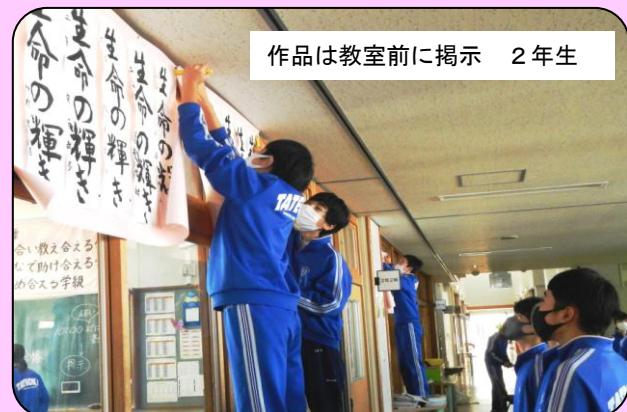
作品は教室前に掲示 2年生