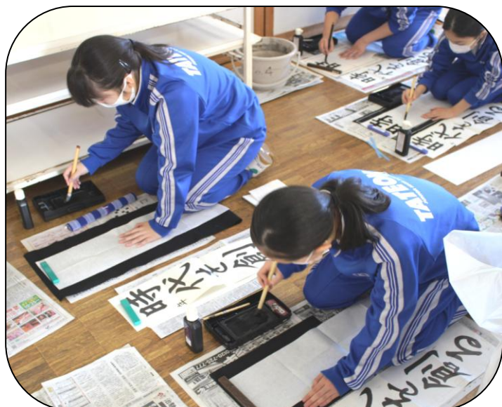
1年生では、床で書く正統派も。

1月6日、第3学期の始業式を行いました。その後、各学年とも書き初めを行いました。題字は、1年生は楷書で「時代を創る」、2、3年生は行書で「生命の輝き」です。書き初めのねらいは、日本の伝統的な文化行事に触れること、毛筆に親しむこと、そして、落ち着いた気持ちで新学期を迎えること、です。さて、作品のできればは?