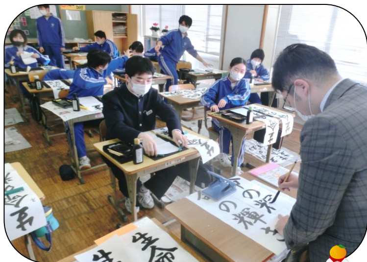
3年2組では、担任の丸子教諭も書き初め。なかなかの腕前です。