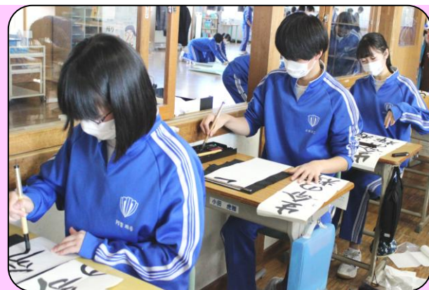
3年生の真剣な書き初めの様子