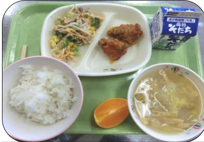
油淋鶏(ユーリンチー) かみかみマヨサラダ オレンジ 白菜の味噌汁 ご飯 牛乳