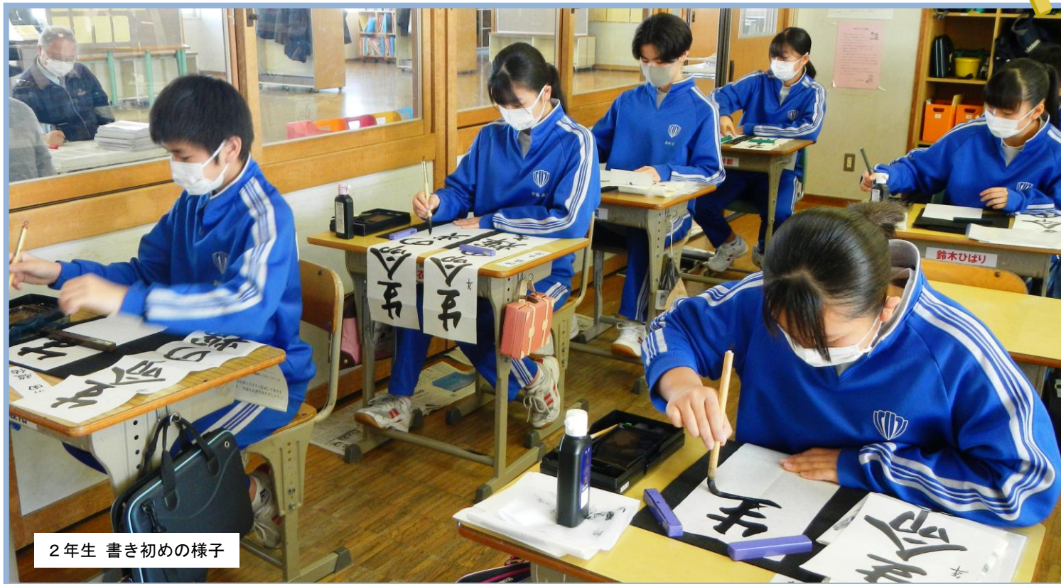
2年生 書き初めの様子