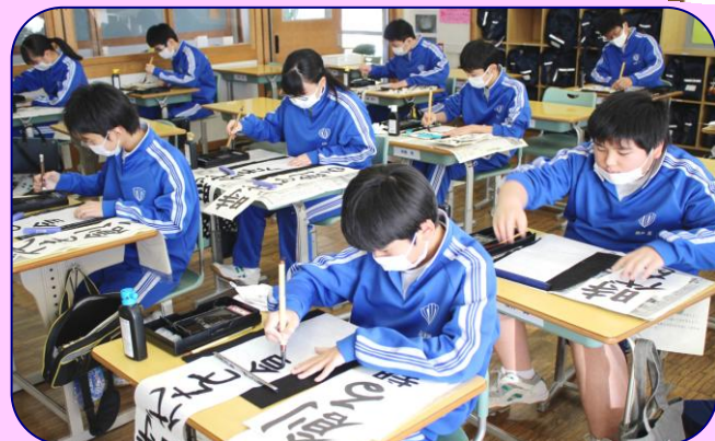
1年生も集中して筆を運びます