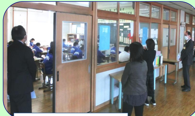
小学校の先生方が1年生の授業を参観

楯中を会場にして行う予定だった5月の第1回目が、臨時休業により中止になったため、楯中での開催は今年初めて。議題は「生徒指導」。3つの小学校の校長先生や担当の先生がいらっしゃいました。義務教育9年間を見通した連携の大切さを確認しました。