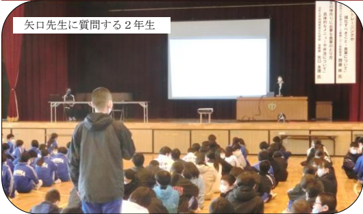
矢口先生に質問する2年生