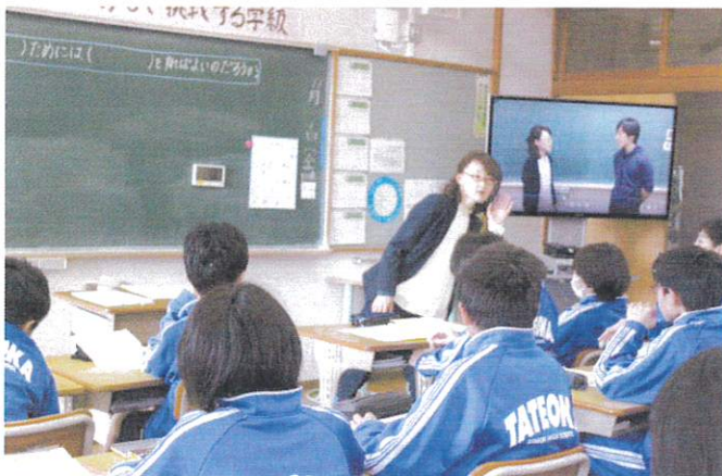
【1年 英語 Our New Friend】

一方で課題として指摘していただいたのは、「生徒たちが発話していた中には語順の間違いが含まれていた。しかし、探究型の学習ではその誤りをもとに次に進むことができる。今後の学習につなげてほしい」とか「基本に戻り、何を考えさせたいかという生徒の姿から課題を設定すること」等々。今後の授業づくりにつなげていきます。