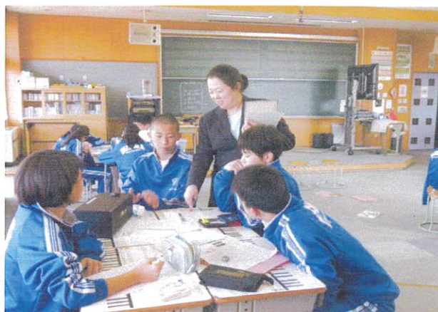
【1年 音楽 日本民謡のよさを味わおう】

「山形県社会科研究会最北協議会」は「よりよい社会を形成していく力を育てる社会科学習」のテーマのもと、北村山地区と最上地区の先生方（約80名）が集まり、授業公開、分科会、全体会を行いました。授業公開では本校の1年生と2年生の授業を見ていただき、話し合いが行われました。1年生は歴史の授業で「貴族から武士の時代へと変わる節目」を扱い、「歴史が動くとはどういうことか」を考えさせたところ、「政治の中心が変わること（今回は貴族から武士に変わる）」などの意見の他に、「人々の暮らしや生活の様子が大きく変わること」と庶民視点での意見もあり、参会者を感心させていました。