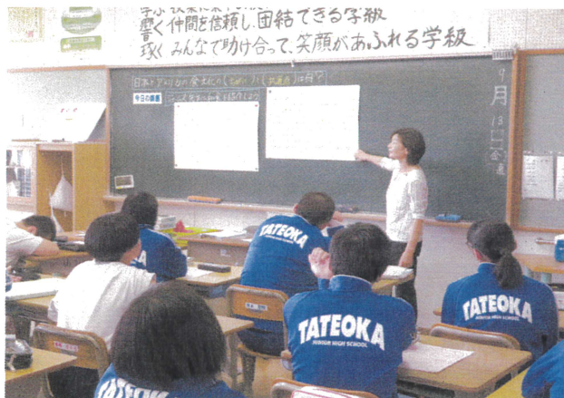
【2年英語科 Enjoy Sushi】