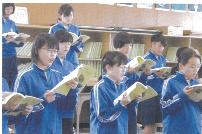
【2年音楽科 合唱の喜び】