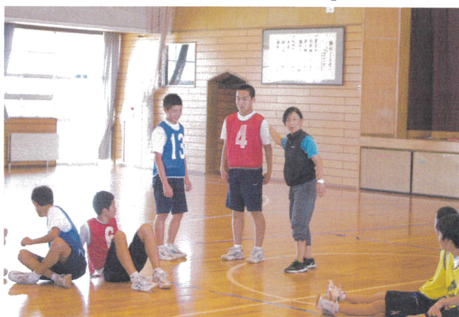
【3年保健体育科 球技 バasketボール】

10月が近づくにつれ涼しさが増し、過ごしやすい季節になりました。汗だくで授業をしていた日々が嘘のようです。そんな中、9月12・13日に、「よりよい授業づくり」をめざして、校内授業研究会を行いました。今回は、3年の国語科、1年と3年の数学科、1年の理科、2年の英語科、2年の音楽科、2年の家庭科、3年の保健体育科、そして1年の道徳で実施し、外部から助言者を招き、意見交換を行いました。上の写真はその時の様子です。