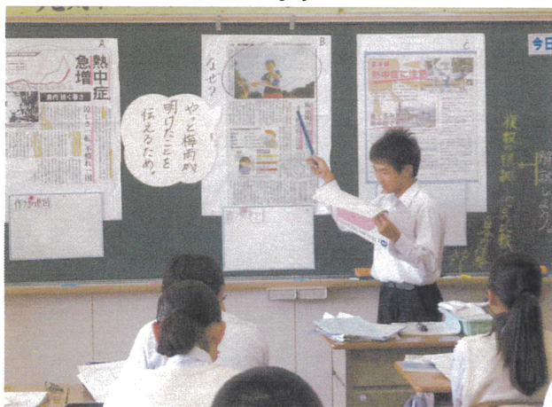
【3年国語科 情報社会を生きる一員として】