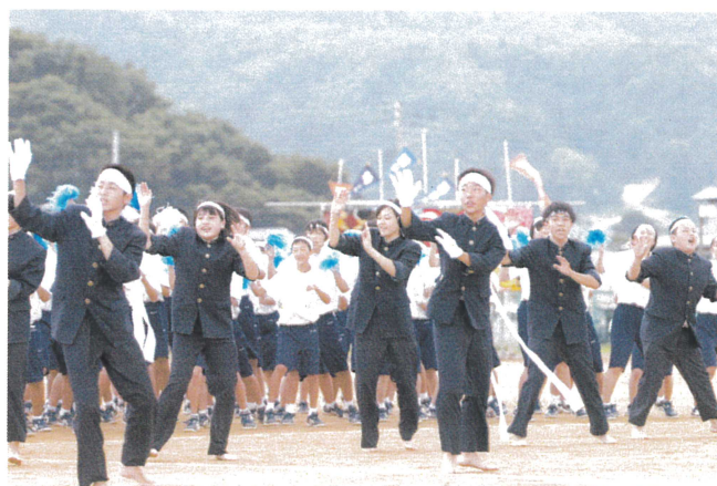
【応援合戦 赤組の様子】