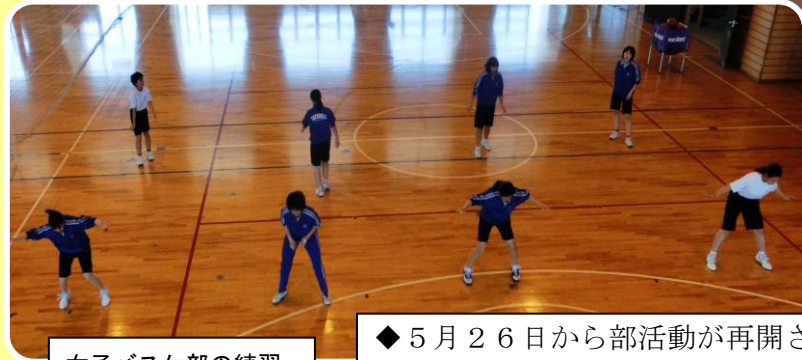
女子バスケ部の練習