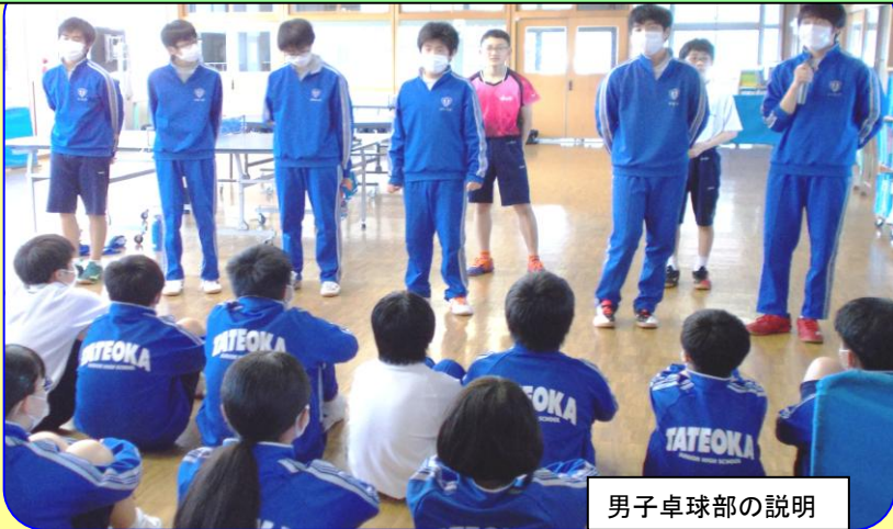
男子卓球部の説明

6/2(火) 4(木) 5(金) 1年生部活動見学 6/9(火) 11(木) 12(金) 1年生部活動体験 1年生も入部を決めるために活動を見学・体験