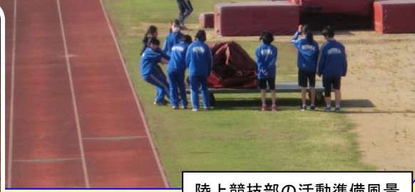
陸上競技部の活動準備風景

◆ 5月26日から部活動が再開されました。初日は、2・3年生が新顧問とミーティングを行い、今後の活動のルールや予定などを確認しました。感染防止を意識しながらの慎重な活動再開となりました。 ◆ 6月2日からは、1年生の見学、体験もあり、各部の2・3年生は、新入部員獲得のために精一杯のアピールを展開。各部の歴史や伝統、素晴らしさや意気込みを全身で1年生に伝えました。