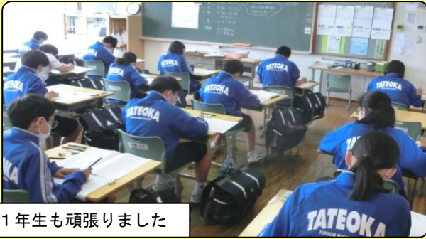
1年生も頑張りました

休校期間があったため、例年よりも遅い実施となりました。国語、社会、数学、理科、英語の5教科の実施です。