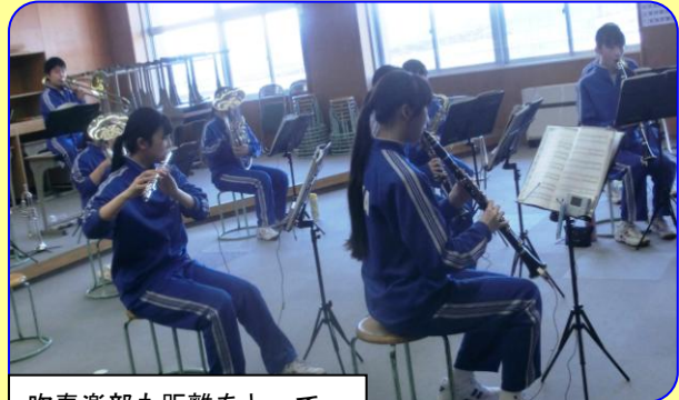
吹奏楽部も距離をとって