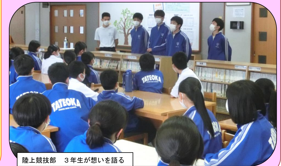
陸上競技部 3年生が想いを語る

道徳の授業『コロナに関するニュース記事』心を耕す 学校再開 ⇒ 新型コロナウイルスを題材にした道徳の授業を 各クラスで実施 [写真は6/3(水) 3年3組の様子]