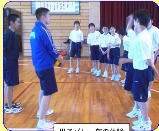
男子バレー部の体験