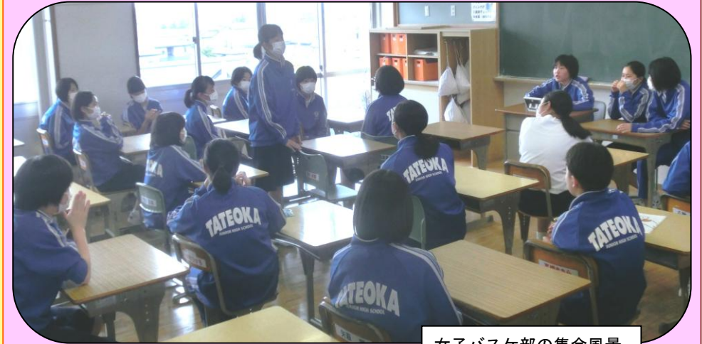
女子バスケ部の集会風景

1年生の入部も決まり、各部とも正式部員が決定しました。1年から3年までの全部員がそろっての初めての集会です。自己紹介の後、3年生を中心に熱心に部の運営について語り合いました。3年生は、後輩に多くのことを伝えてくれたはずですよ！