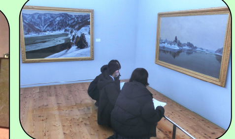
美術館で豊かな時間を過ごしました