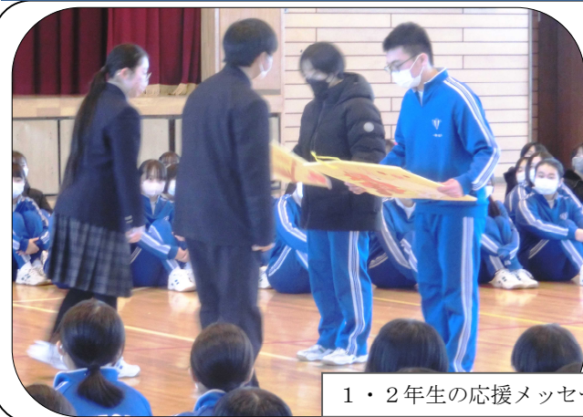
1・2年生の応援メッセージが貼られた絵馬を3年生に

受検期を迎えた3年生に、1・2年生が激励会を開きました。3年生は、自分の進路達成に決意を新たにしました。