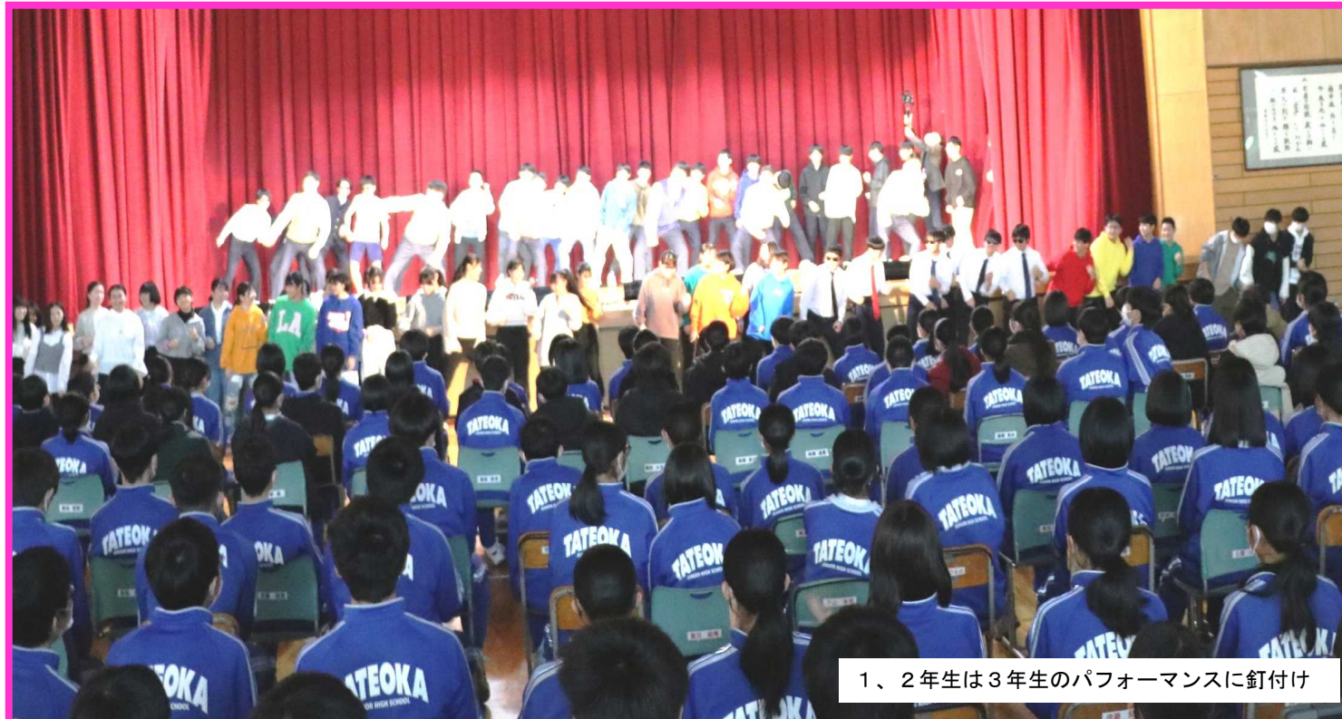
1、2年生は3年生のパフォーマンスに釘付け