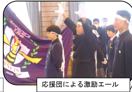
応援団による激励エール