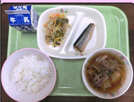
芋煮汁 さんまの塩焼き 菊花入りお浸し ごはん 牛乳