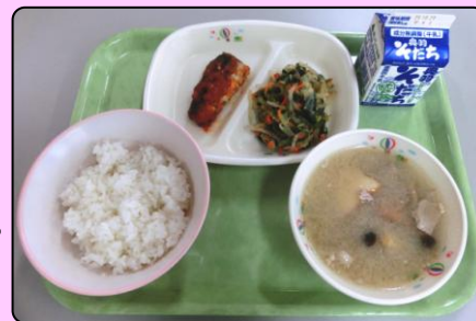
庄内風芋煮汁 さんま紅葉煮 お浸し ごはん 牛乳

今回は、豚肉と味噌味の庄内風芋煮です。しめじが良い味でした。さんまの紅葉煮もご飯によく合います。