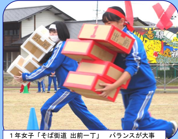
1年女子「そば街道 出前一丁」 バランスが大事