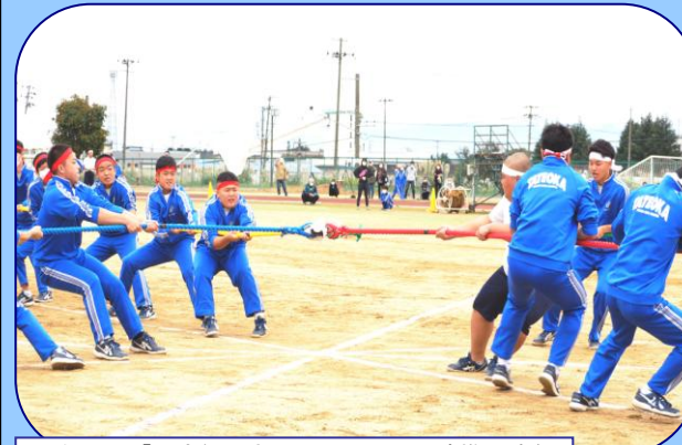
3年男子「四方綱引き」 力と頭脳と連携の勝負