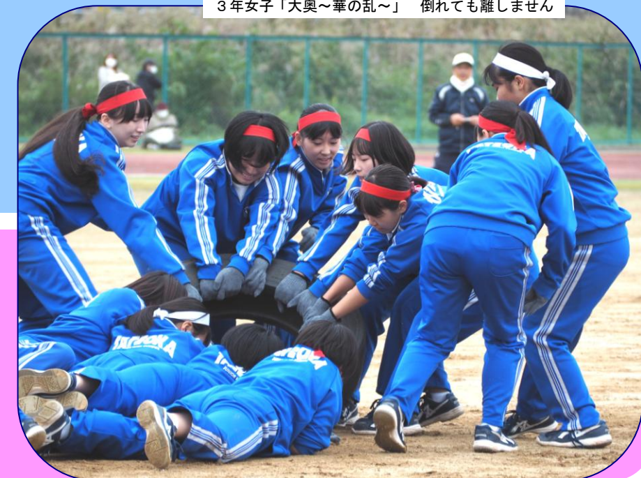
3年女子「大奥～華の乱～」 倒れても離しません