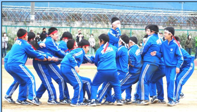
1年男子「棒取り」 協力と力のいれ具合