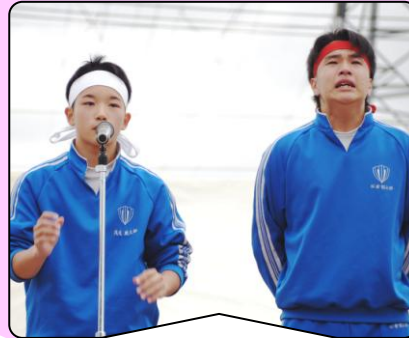
戦いを終えた両組頭の 心のもったあいさつ