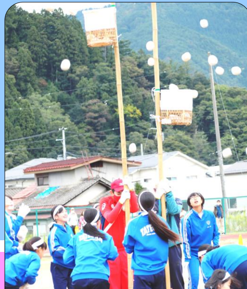
2年女子「ローズまり入れ」 道具は楯岡小からお借りしました