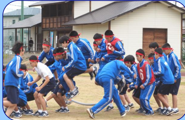
2年男子「最上川三難所リレー」 呼吸を合わせて