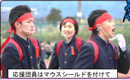
応援団員はマウスシールドを付けて