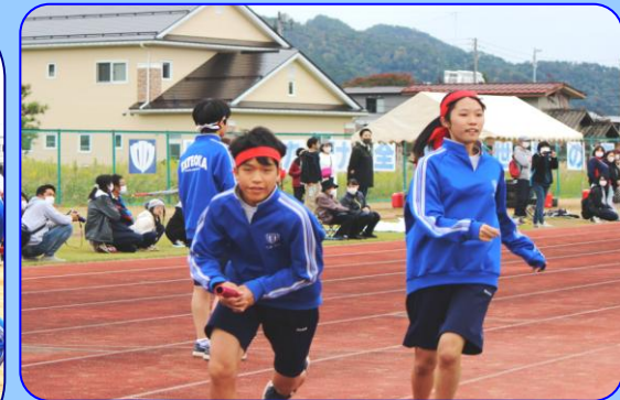
「絶対抗リレー」 男女混合全員リレーです