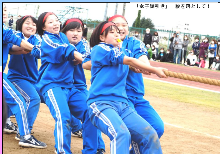
「女子綱引き」 腰を落として！