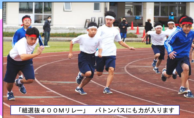
「組選抜400Mリレー」 バトンパスにも力が入ります