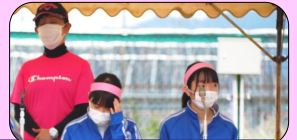
進行も実行委員会で行いました