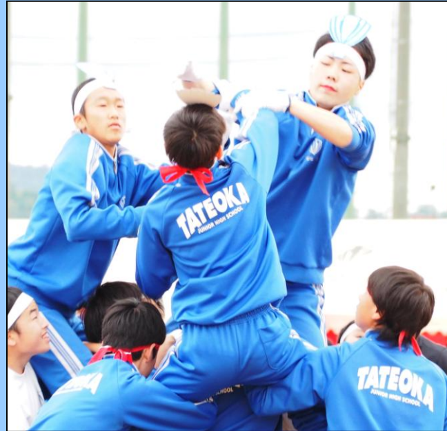
「男子騎馬戦」 待ったなし 迫力の本勝負