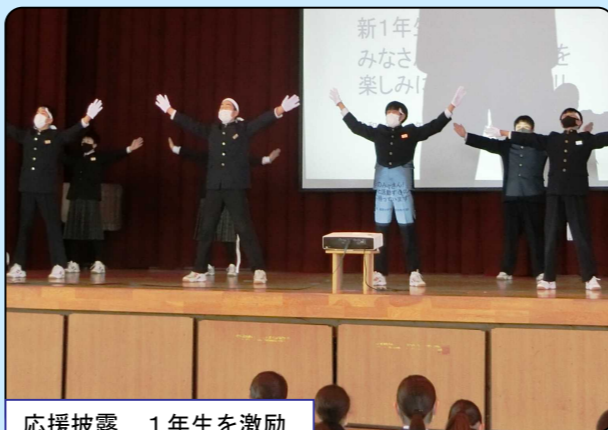
応援披露 1年生を激励