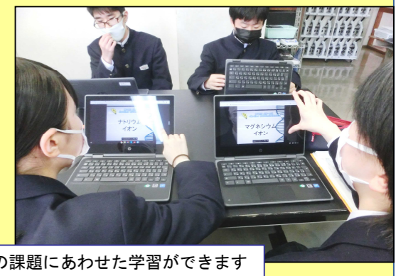
自分の課題にあわせた学習ができます