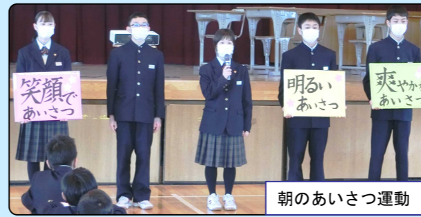
朝のあいさつ運動