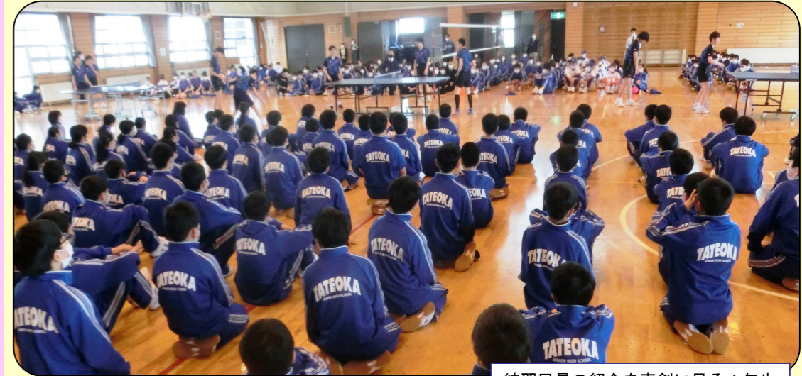
練習風景の紹介を真剣に見る1年生

1年生のための部活動の説明会が、生徒会主催で行われました。各部とも部員確保のために必死にアピール！ 1年生はこの説明会を参考にし、部活動見学、体験を行った上で入部を決め、5月10日に部ごとのミーティングを行いました。