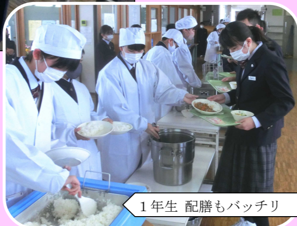
1年生 配膳もバッチリ

入学・進級祝いメニュー チキンカレー 和風サラダ ごはん 牛乳 お祝いデザート (クレープ)