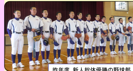
昨年度 新人総体優勝の野球部