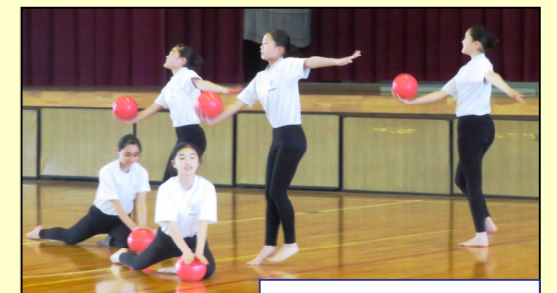
フェアリー楯中の演技