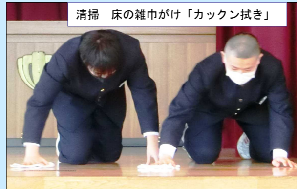
清掃 床の雑巾がけ「カクン拭き」