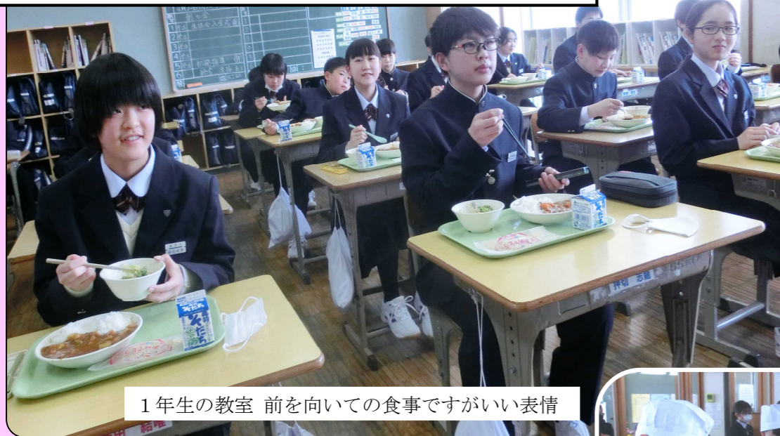
1年生の教室 前を向いての食事ですがいい表情

今年度初めての給食は、入学・進級祝いメニュー。みんなに人気のカレーです。クレープにも大喜びでした。