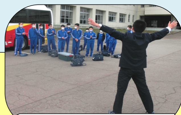
朝 出発前に生徒の有志がエールで激励