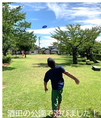
酒田の公園で遊びました！