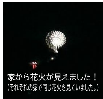
家から花火が見えました！ (それぞれの家で同じ花火を見ていました。)

既に学校の授業で活用している1人1台のタブレットPC。今年の夏は、全員持ち帰って学習やふれ合い交流で活用しました。