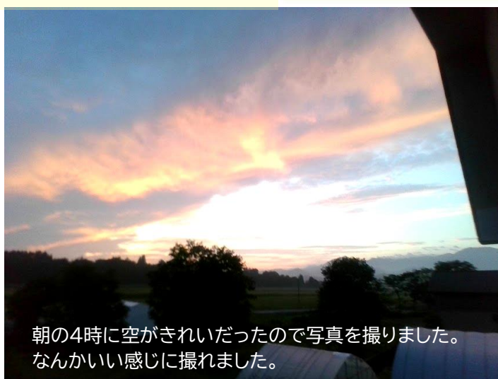
朝の4時に空がきれいだったので写真を撮りました。 なんかいい感じに撮れました。

子どもたちの名カメラマンの作品の数々！ほんの一部を紹介いたします。発見の素晴らしさや感じ方の良さ、ふれ合いの雰囲気が十分に伝わってきます！