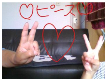
おばあちゃんと遊んだよ！ どっちが おばあちゃんの手でしょう？