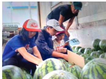
すいかのおてつだい。 シールはりをしました。