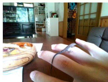
カナヘビが生まれた！！

子どもたちの名カメラマンの作品の数々！ほんの一部を紹介いたします。発見の素晴らしさや感じ方の良さ、ふれ合いの雰囲気が十分に伝わってきます！