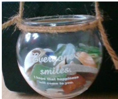
お気に入りの海コレクション 今年もキレイな貝がらゲット！

地域や家族でふれ合う時間を大切にするとともに、地域や家族の良さや自分と地域・家族とのかかわりを再認識し、子どもも家庭も地域も元気になることを通して、子どもたちの健全な育成を目指すことを目的に、昨年度10月臨時休業としたPTA合同企画『地域・家族ふれ合いデー』。