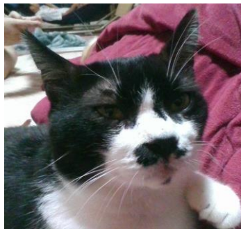
家のネコの写真を トリミングしてみたよ！

富並小学校版クラスルーム(村山市学習イントラNet上)で夏休み中のふれあい情報をみんなで交流したよ！