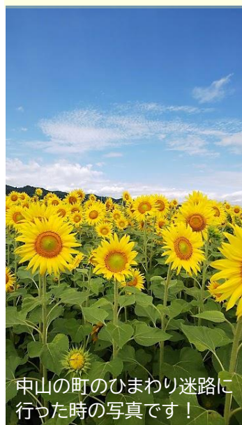
中山の町のひまわり迷路に 行った時の写真です！

今年度は、夏休み中に自由にその時間を設定し、地域や家で発見したこと、地域や家族とふれ合ったことなどを広く富並小学校版限定イントラNet上でお互いに情報を交流し合うことにいたしました。