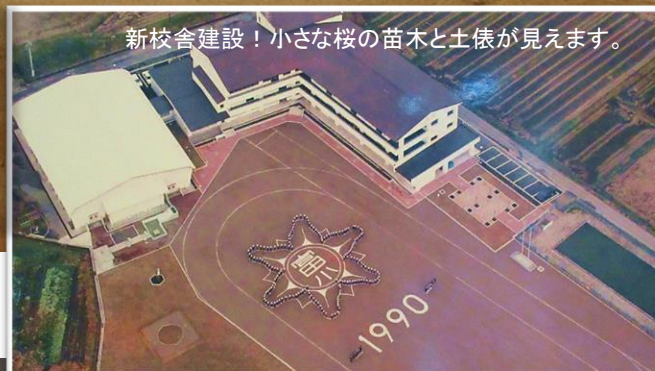
新校舎建設！小さな桜の苗木と土俵が見えます。

富並小に屋形のある相撲場はない—— 調べてみたが、この“青空土俵”が、富並小の土俵なのだ。 青空の下、四股を踏む。 恵みをもたらすこの大地の上で。 この大高根の大地は、大高根っ子の巨大な相撲場なのだ。 大地を耕し、肥沃な大地へと変え、 力強く生きていく、夢と希望をもって——