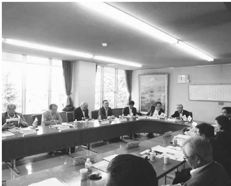
村山市を訪れた戸田市議会広報委員の皆さん

5月22日、埼玉県戸田市議会広報委員会の視察が庁舎内で行われました。当日は、戸田市議会の正副議長をはじめ、広報委員10名、随員の事務局2名と総勢14名で、議会だよりの編集方法について、議会だより最新号についての意見交換を行いました。