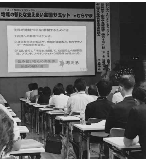
地域の新たな支えあい全国サミットinむらやま

Q 住み慣れた地域で暮らして良かったと思えるような地域力を醸成するための若者、老熟年交流の方策は。