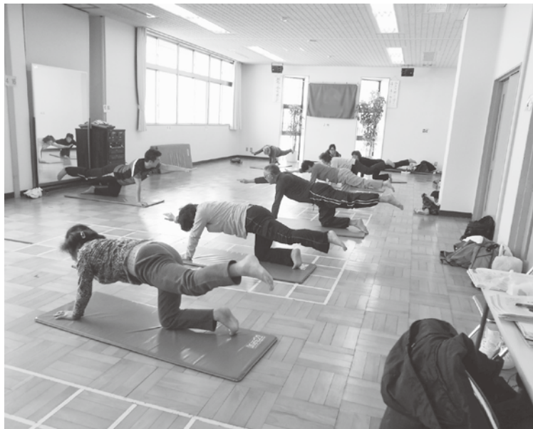
健康づくりヘルスアップ講座

健康づくり事業のマトリクス化は実態調査し対応する。クアハウスは保健課委託事業の他、独自の事業を行い6千名の利用がある。健康づくりを視点に置き特徴出さすよう内部で検討する。抑制対策は特定健康診査の結果に基づき、生活習慣改善の必要者に積極的支援、動機付支援の特定保健指導を行っている。今年は対象者を30才まで下げ、生活習慣病予防、病気の重症化を防ぎ医療費抑制に取り組む。また市民の健康づくりの内容の充実