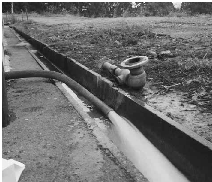
無届け放流口からの放流（昨年10月アシスト産廃処分場）