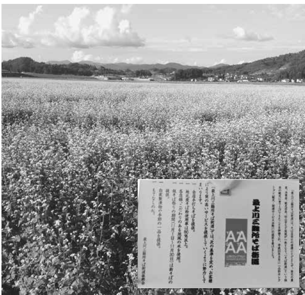
地元産の玄蕎麦を使用した手打ち蕎麦が売り物