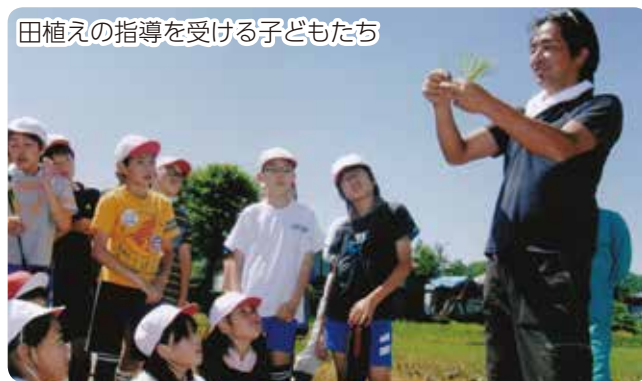
田植えの指導を受ける子どもたち