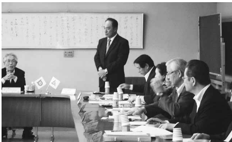
歓迎のあいさつをする海老名議長