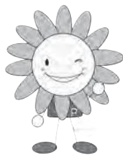
市健康づくりキャラクター ぽっぴー