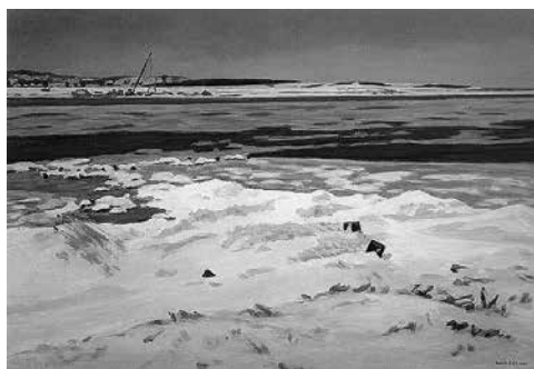
真下慶治作「冬・河口のあたり」