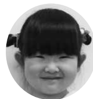
あらかし りこちゃん