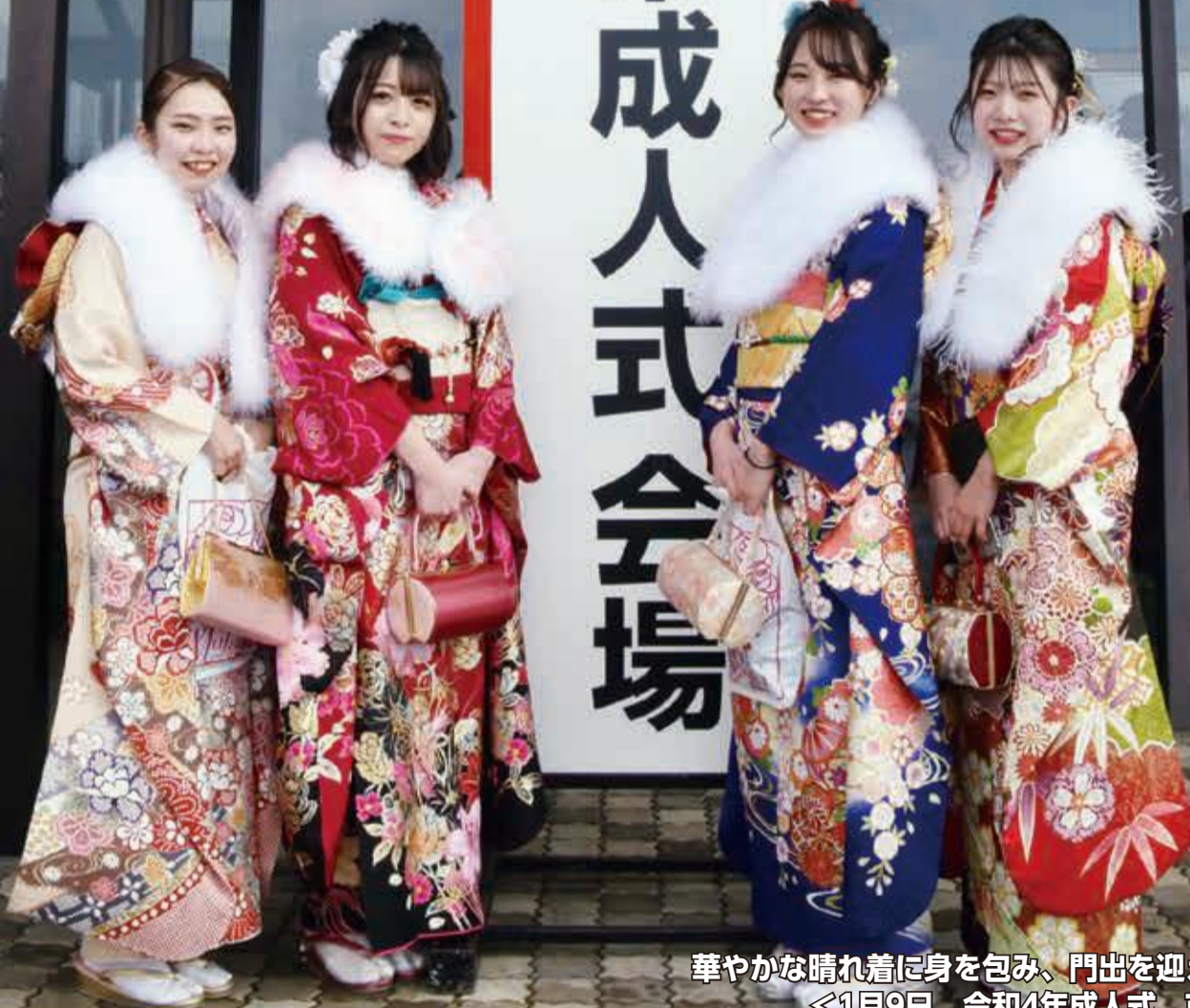
華やかな晴れ着に身を包み、門出を迎えた新成人 ＜1月9日 令和4年成人式 市民会館＞ ※撮影時のみマスクを外しています。