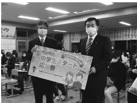
楯岡中学校での贈呈式の様子