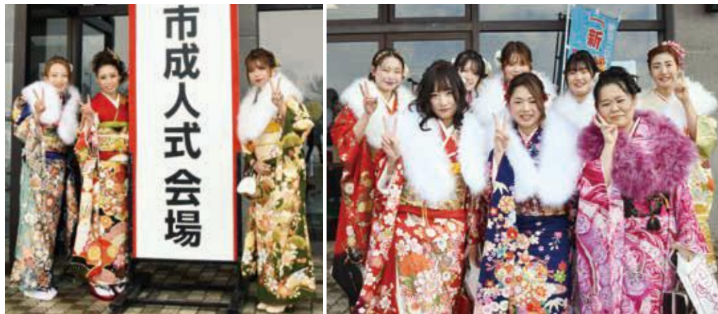
華やかな着物に身を包んだ新成人の皆さん