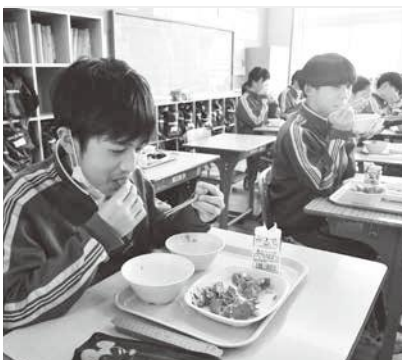
花咲ガニ鉄砲汁を味わう生徒たち

花咲ガニを使った鉄砲汁に生徒たちは「出汁がすごくてとてもおいしい」と話し、北海道の旬の味を存分に楽しみました。