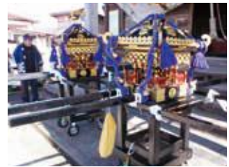
歴史と伝統ある「子供みこし」