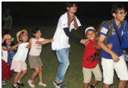
大人から子どもまで一緒に楽しむ「親子500人集会」

これらのほか、青少年に関わる各界の代表者等で「青少年健全育成協議会」を組織し、定期的な情報交換などを行いながら、地域の子どもたちをあたたく見守っています。