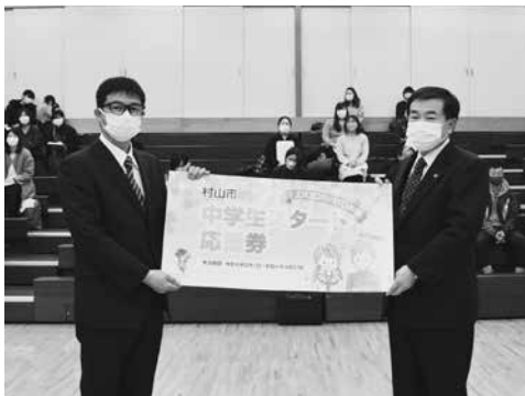
葉山中学校での贈呈式の様子

市ではこのほか、市内在住の高校生等を対象に「がんばる高校生応援金」として年額50,000円を支給するなど、保護者の経済的負担を軽減することで、子育て世帯を応援しています。