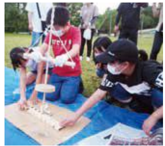
「親子500人集会」での火おこし体験

大久保地域では、子どもたちの健全な成長発育を促すため、地域を挙げて積極的に支援しています。