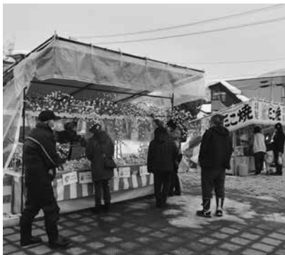
だんご木などの縁起物を買って求める来場者

会場となったふれあい広場には、だんご木などの縁起物をはじめ、食べ物や販売する露店が並び、家族連れなど多くの方々が来場。色鮮やかなだんご木やふなせんべいなどの縁起物を買って求めました。