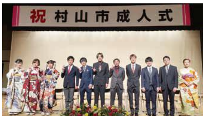
企画・運営で成人式を盛り上げた実行委員の皆さん

令和4年村山市成人式を1月9日、市民会館で行い、村山市在住または村山市出身の新成人149人が出席し、新成人の門出を祝いました。新型コロナウイルス感染拡大防止のため、会場への入場を新成人のみに限定し、申込み制で開催しました。