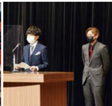
誓いの言葉を述べた副実行委員長の2人