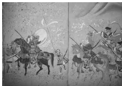
源平合戦図屏風（部分図）