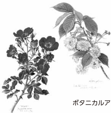
ボタニカルアート展