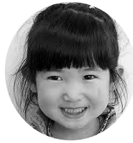
かの つばさちゃん