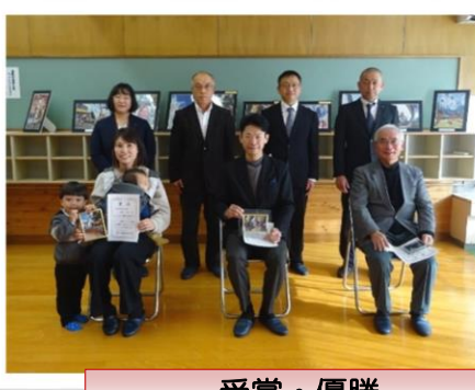
受賞・優勝 おめでとうございます!

また、16日から30日には写真展が行われ、応募された中から選ばれた18点やスナップ写真が市民センターに展示されました。期間中はたくさんの方がお越しくださいました。