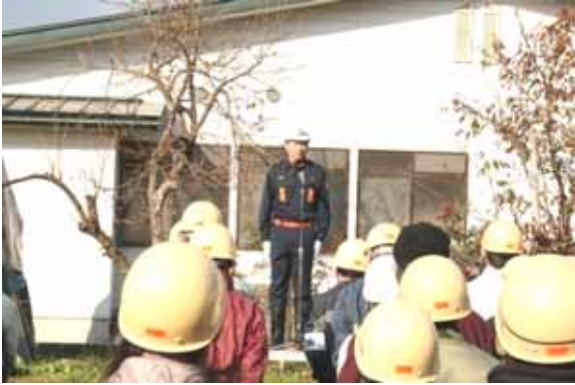
→ 婦人消防クラブによる軽可搬ポンプ放水訓練