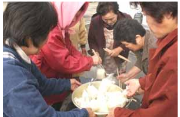
→ 避難所運営訓練(応急炊き出し訓練)

11月2日(日)に大倉地域防災訓練が林崎・大上地区を中心に行われました。 訓練は避難所運営訓練、消火器訓練、救出搬送訓練、応急手当訓練を行い、また婦人消防クラブによる軽可搬ポンプ放水訓練、消防団による火災防衛訓練も行われました。 万が一に備え、参加者は真剣に訓練に取り組み、大変充実したものととなりました。