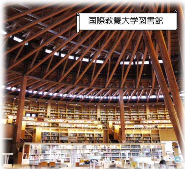
国際教養大学図書館