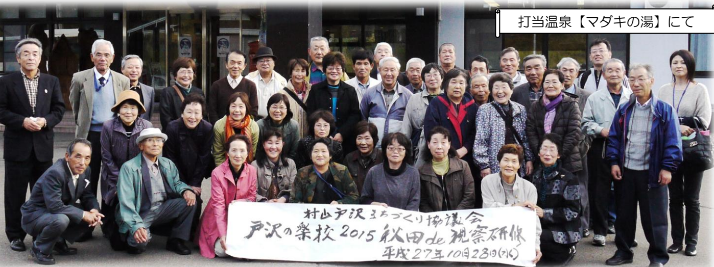
打当温泉【マダギの湯】にて