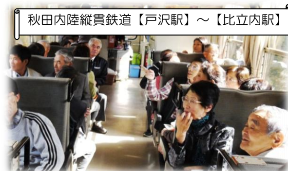
秋田内陸縦貫鉄道【戸沢駅】～【比立内駅】