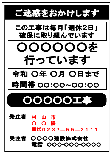
(図) 工事標示板への明示の例