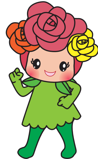
| pose #4 |