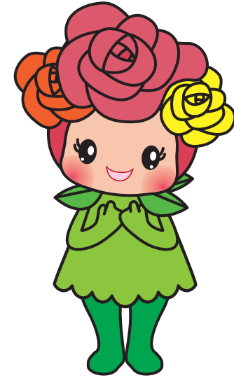
| pose #2 |