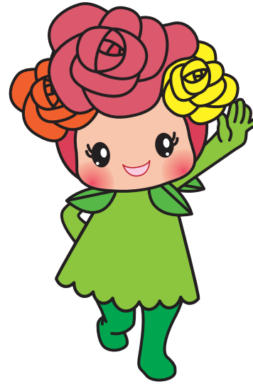
| pose #1 |