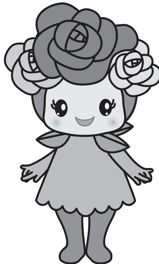
Mascot Character | Mono | Outline