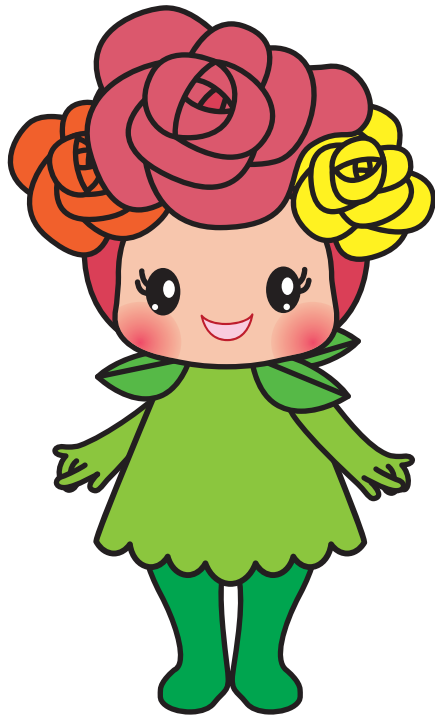
Mascot Character | basic pose