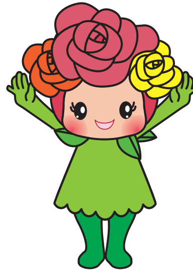
| pose #3 |