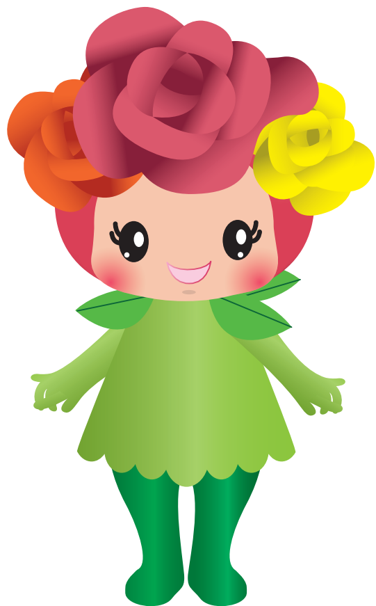
Mascot Character | Shading