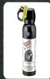
クマ撃退スプレー

④ 万一、クマに出合ったら、背を向けずに、ゆっくり後退してください。(クマ撃退スプレーの使用も有効です。)