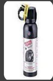
クマ撃退スプレー