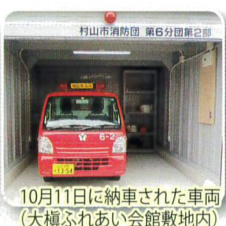
10月11日に納車された車両(大槇ふれあい会館敷地内)

新しい活動スタイルで六分団団員一丸となり地域安全のため、火災予防活動に力を入れていきたいと思っております。