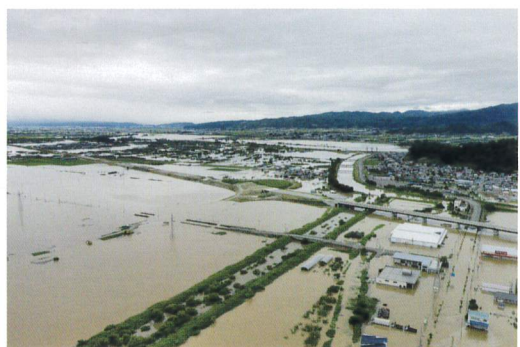
村山市中央地区上空より西側を撮影

一人一人が自分を守る行動をすることによって、被害を少なくすることが できます。 日頃から災害に対するの備えを忘れずに行いましょう。