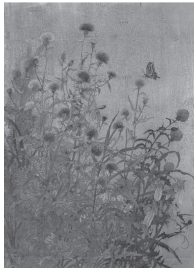
《アザミに深き我が想い》 P30号