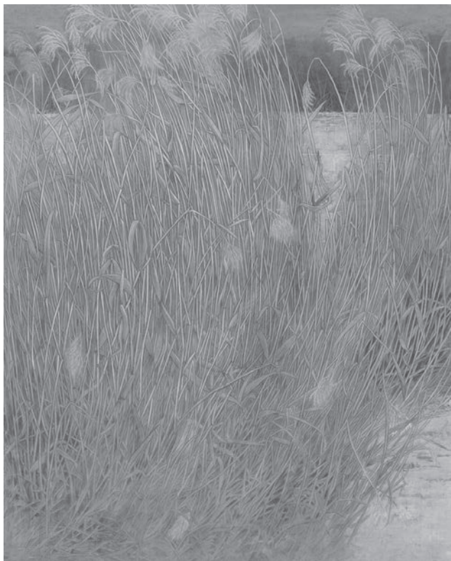
《春夏秋冬の風》 F130号 再興第106回院展入選作

2006年 河北展宮城県芸術協会賞受賞 2010年 山形県総合美術展日本画部門奨励賞受賞 2011年 第66回春の院展初入選 以後(73・76・77・78・79回)5回入選 山形県総合美術展日本画部門奨励賞受賞 2014年 山形県総合美術展日本画部門奨励賞受賞 2016年 山形県総合美術展日本画部門山形新聞社賞受賞 2019年 再興第104回院展初入選「初夏の頃」 2020年 再興第105回院展入選「春曆」 2021年 山形県総合美術展日本画部門奨励賞受賞 再興第106回院展入選「春夏秋冬の風」・院友推挙 山形県美術連盟運営委員 2022年 山形県総合美術展日本画部門委嘱 2025年 再興第110回院展入選「散歩道」 現在 山形市在住、日本美術院 院友