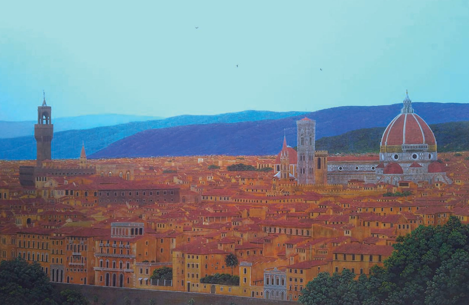
《フィレンツェ》 2026年 M30号 油彩