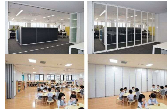
※可動間仕切り折戸イメージ図 上段：透明タイプ 下段：目隠しタイプ