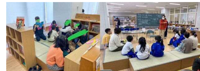
※タタミベンチイメージ図