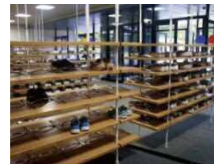
※シースルー下足入れイメージ図