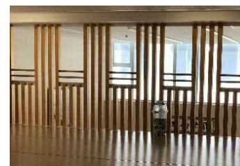
※転落防止用デザイン 木製格子イメージ図