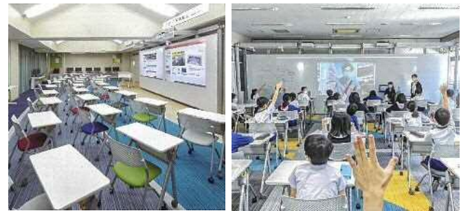
※フューチャークラスルームイメージ図