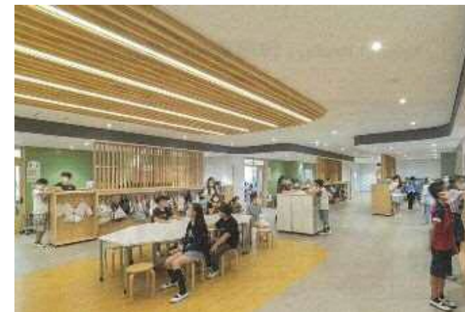
※天井木製格子イメージ図