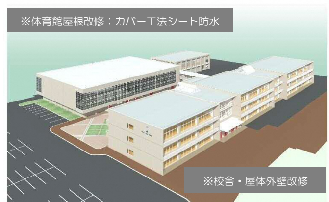
※体育館屋根改修：カバー工法シート防水