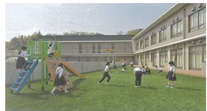
※中庭遊具新設・人工芝のイメージ図