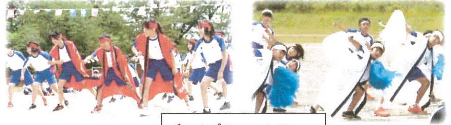
チームパフォーマンス