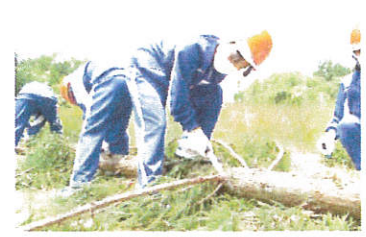
6/22 6年生 学校林の伐採作業体験