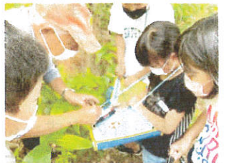
6/22 4年生 「自分の木」を見つけよう