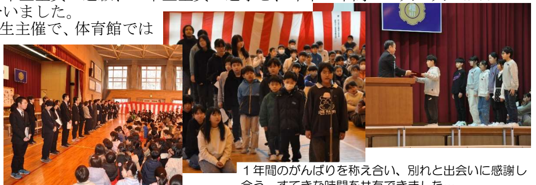
1年間のがんばりを称え合い、別れと出会いに感謝し合う、すてきな時間を共有できました…

お別れ会は、6年生主催で、体育館では学年担任外の教職員一人一人に子供たちから温かいメッセージをいただきました。各担任には、教室に戻ってからメッセージをいただきました。