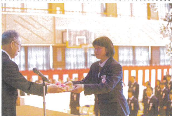
【教科書給与の場面】

多種多様なものの見方や考え方があることを知り、ひとつのものを様々な面から見たり、考えたりできる力を身に付けてください。・・・