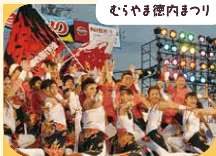
むらやま徳内まつり