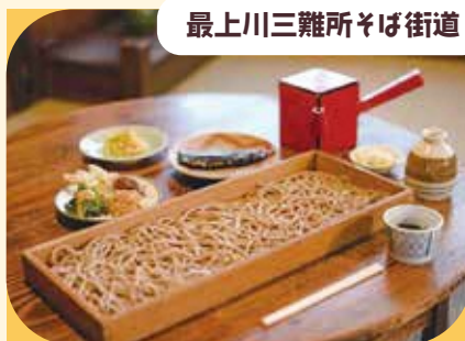
最上川三難所そば街道