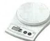
キッチンスケール