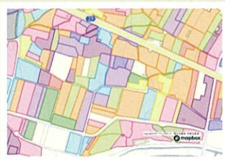
農業委員会サポートシステムを使用