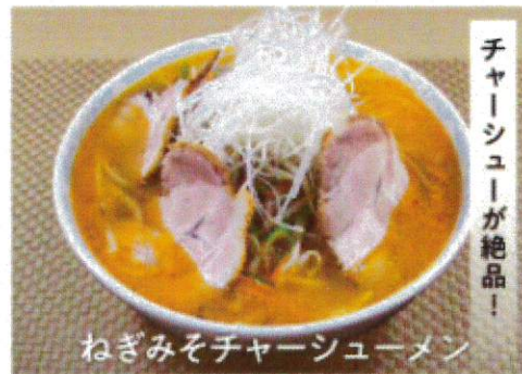
こだわりラーメン