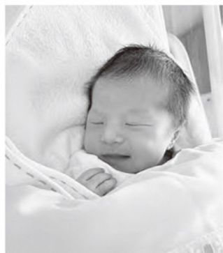
こんにちは赤ちゃん

A 地域医療を支えていくため、今後も現在の体制を維持し、医療機器更新や診療体制の充実を進める。医師確保は重要課題であり、関係機関と連携し確保に努め、公立病院を中心に地域医療を守っていく。