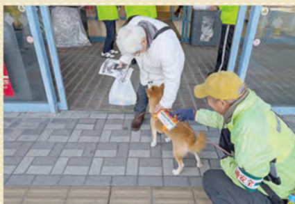
元気にパトロール