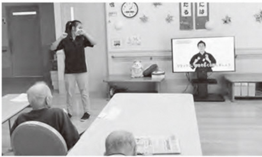
体操を指導する技能実習生