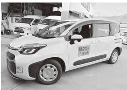
発車オーライ!!乗合いタクシー