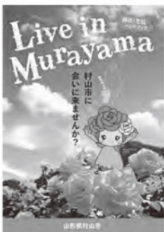
移住・定住ハンドブック 村山に会いに来ませんか？