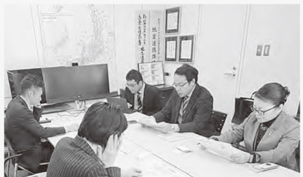
ふるさとと住民登録制度を学ぶ

「ふるさとと住民登録制度」は、人口減少下の地域で担い手を確保するため、住民以外の「関係人口」を可視化・育成する制度です。アプリで誰でも登録できるベーシック登録と、年3回以上の地域活動を要件とするプレミアム登録の2種類があります。登録証で地域貢献を可視化し、交通費補助などのサポートを提供します。国が共通システムを開発し、モデル事業で運用を具体化し、全国展開を目指しています。