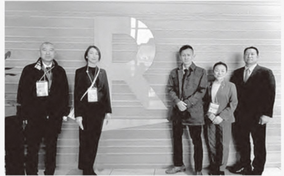
楽天市場での学びを胸に未来を考える

ふるさと納税は地方自治体の重要な財源であり、本市では米への依存度が高い現状です。楽天ふるさと納税は市場で大きなシェアを持ち、AI活用や楽天経済圏の強みを生かしています。本市の目標達成には、米以外のジャンル拡充と事業者開拓が課題です。成功事例では「売れるものを作る」戦略で地域活性化を実現しており、本市も寄附金のリピート率向上のために、返礼品のジャンル開発拡大、既存返礼品の強化、市役所・事業者・楽天の三位一体での取り組みが求められています。寄附金の有効活用による地域創生が重要と感じました。