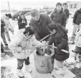
放課後子ども教室「わくわく太陽塾」の活動