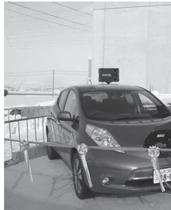
むらやま道の駅の