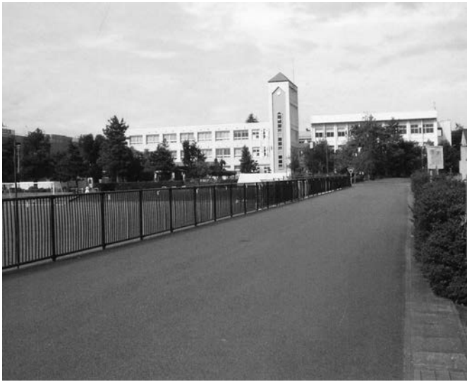
明春開校の村山産業高等学校