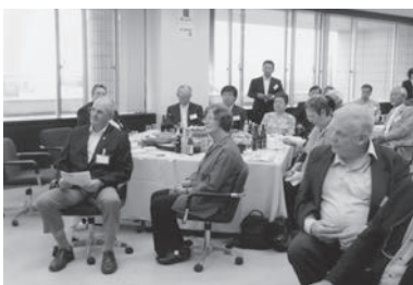
クレランス市との交流会

友好都市締結、徳内まつり20周年の節目を迎え、更なる交流促進を願う厚岸牡蠣まつりや港祭り、そして酪農の現状を視察しました。また、同町と姉妹都市締結30周年を迎えるオーストラリアのクレランス市市長や市議会との国際交流をも企画して頂きました。村山市が目指す交流創造都市の充実のためにも厚岸町や台東区との交流を通じて賑やかな村山市づくりを考えさせられた研修でした。