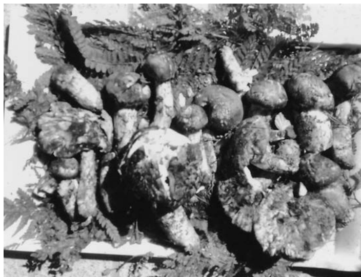
村山は山の幸も豊富。秋の味覚「松茸」

A 自殺対策として大変有効であると聞いています。今後成り行きを見て決めていきたい。