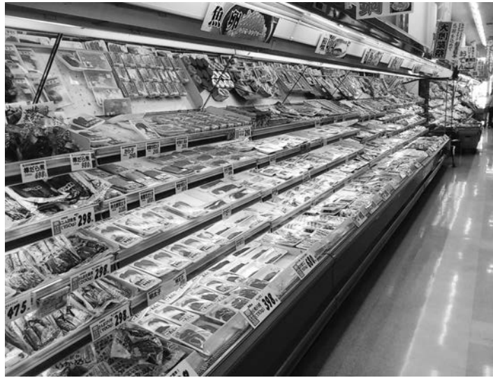
来年4月から消費税が8%に増税

Q ①市長は「保育料の半額補助」を公約したが、保育料だけでなく、児童館使用料や私立幼稚園の保護者負担も含むのか。また、現在半額の第二子についてもか。②子育て支援医療や学校給食費の負担軽減も、さらに拡充すべきではないか。