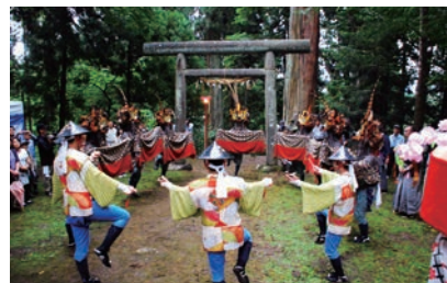
獅子と鉦の皆さん