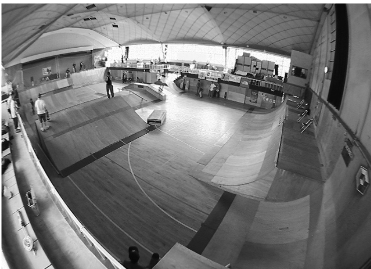
廃校利用した屋内スケボーパーク

対策が必要では。 A 市長公約で出た幕井ランドに児童遊戯施設をまとめる可能性もある。長所を研究して今後検討したい。2次交通は費用対効果を検証しながら検討したい。