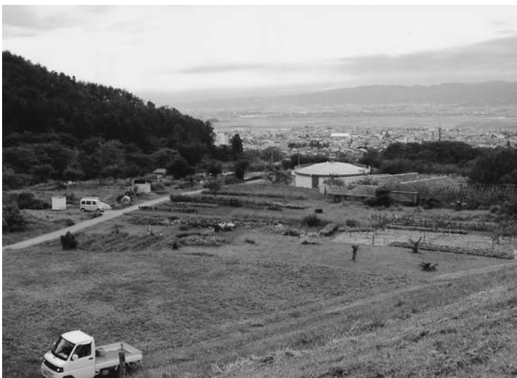
幕井ランド建設予定地