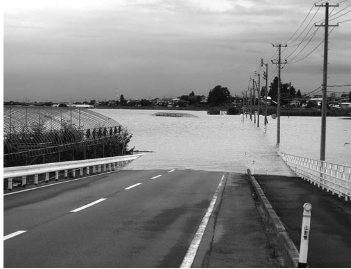
冠水した大久保村山停車場線