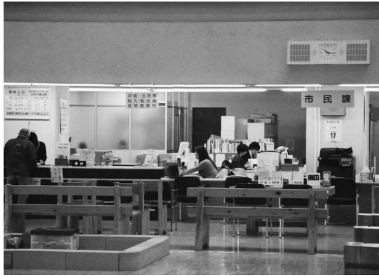
市役所業務は市民生活に直結している

Q 第5次総合計画について、選挙公約「5つの決断」をどのように盛り込むのか。基本計画、実施計画の策定手順行程はどのように考えているか。