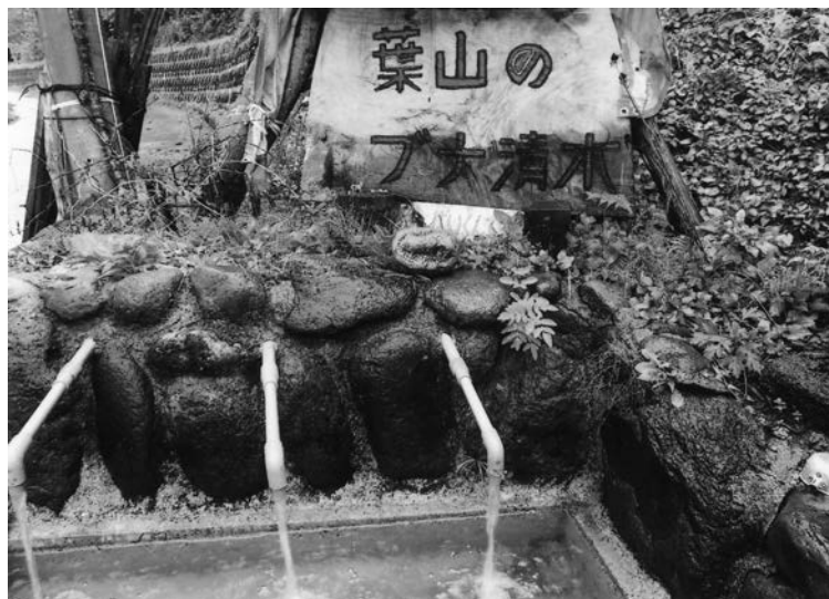
葉山のブナ清水 (山の内)

A 家の前に固い雪を置くのが基本的な考え方で、集める場所を作り、搬出するのが基本的な考え方で、高齢者世帯だけでなく全市民を対象に考えている。